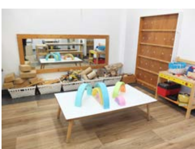
Espai Grans Construccions