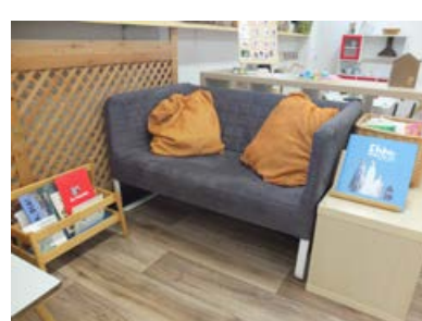
Espai de Lectura

Al llarg del curs, aquestes propostes aniran canviant i evolucionant al ritme dels interessos dels infants.